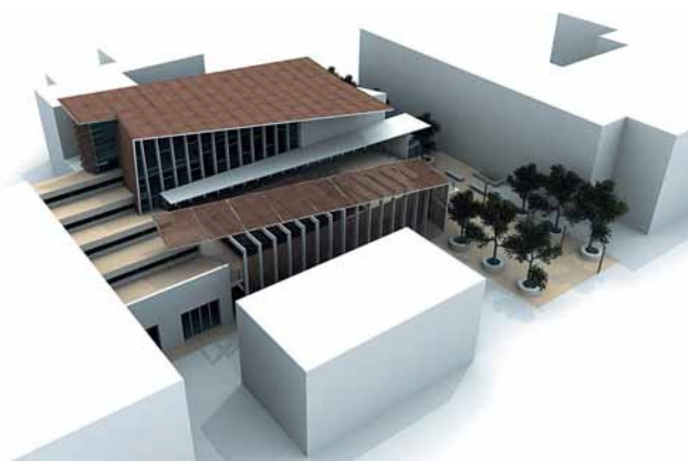
Viste del modello e pianta del piano terra.