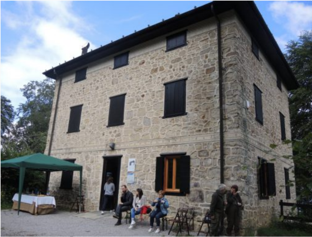
La Casa Museo di Villa Gerosa ai Piani Resinelli

LN lecconotizie.com/attualita/resinelli-gia-1700-visitatori-alla-casa-museo-di-villa-gerosa-327226/