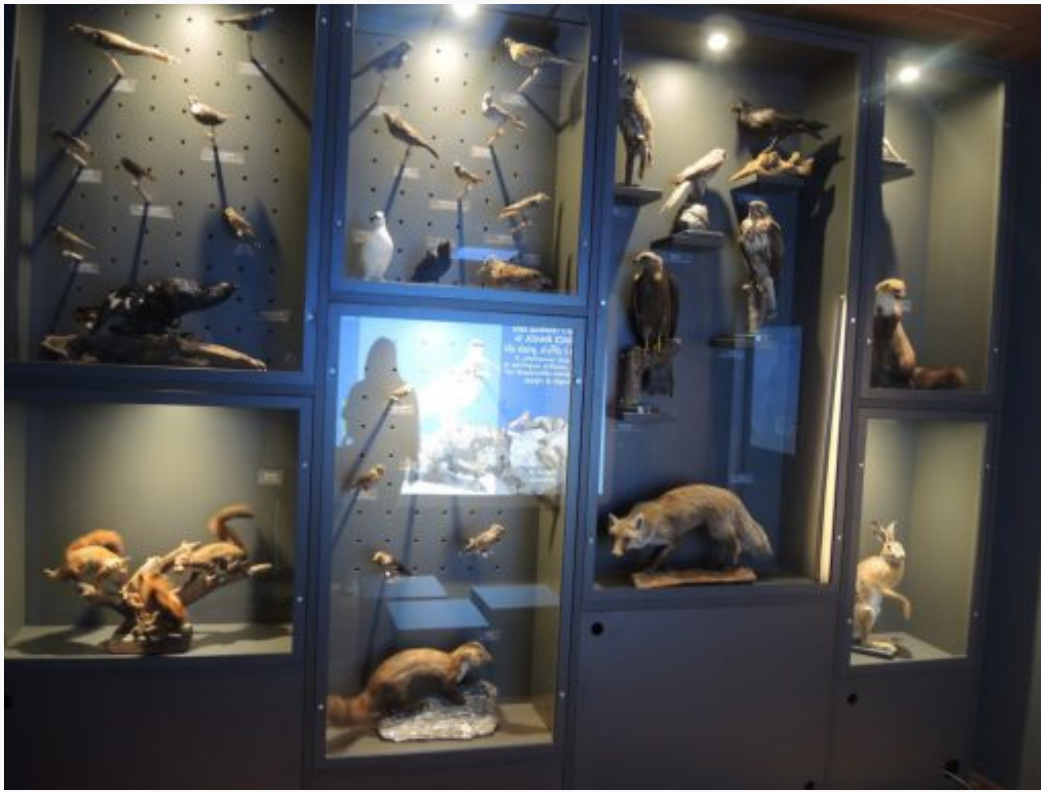
La sala dedicata alla fauna

“Numeri che ci rendono soddisfatti – commentano dalla Comunità Montana – un sentito ringraziamento va ai Volontari delle Associazioni Alpinistiche Gamma, Uoei, Sel e Ragni della Grignetta che con la loro collaborazione rendono possibile l’apertura della struttura, la custodia e l’accoglienza dei visitatori”.